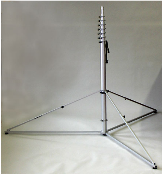
STM 120 mit eingeschobenen Teleskopmast