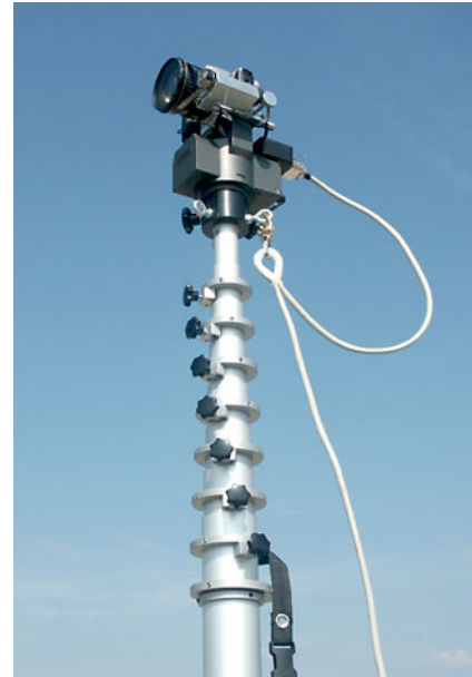
STM 120 mit Remote Control 2 Zoom