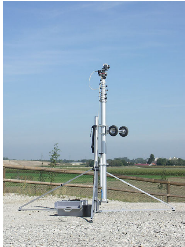
Pneumatischer Teleskopmast im Stativstand mit Kamera-Fernsteuerung vor dem Ausfahren des Teleskopmastes