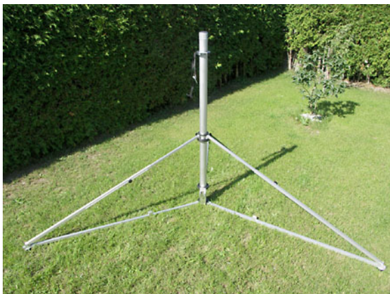
PT 75H ... 105SH Stativstand